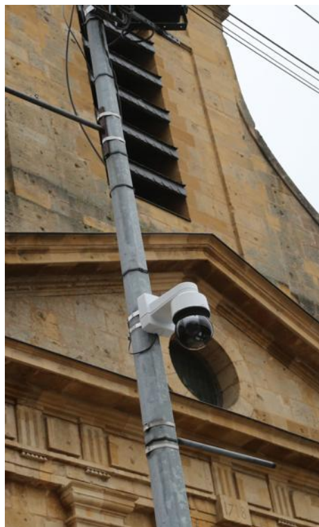
Des caméras de vidéoprotection ont été installées en fin d'année.