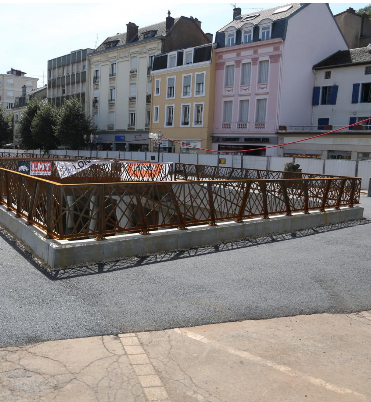
Les travaux de découverte de la Chiers ont marqué cette année 2018 à Longwy-Bas. L'année 2019 va être consacrée aux aménagements de la place Leclerc.